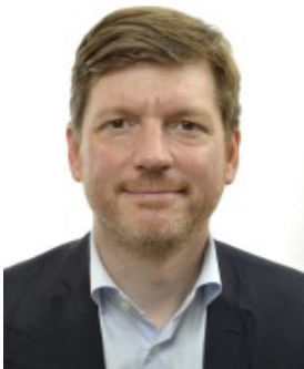
Martin Ådahl [C], Centerpartiets arbetsmarknadspolitiska talesperson

Vid detta nätverksmöte tittar vi återigen på den arbetsmarknadspolitiska agendan, denna gång utifrån Centerpartiets perspektiv. Martin Ådahl [C], partiets arbetsmarknadspolitiska talesperson, berättar om vad de vill ta itu med på området i en givande diskussion med nätverket. Vart bör ett politiskt fokus för arbetsmarknadssektorn riktas?